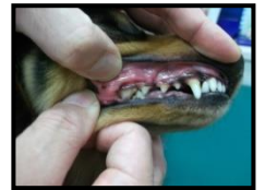
歯石が重度に付着しているお口